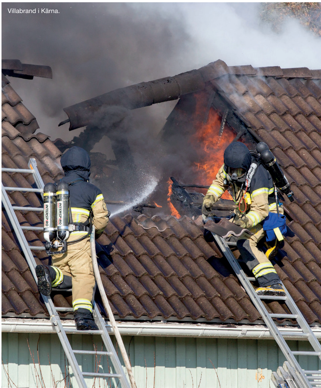
Villabrand i Kärna.